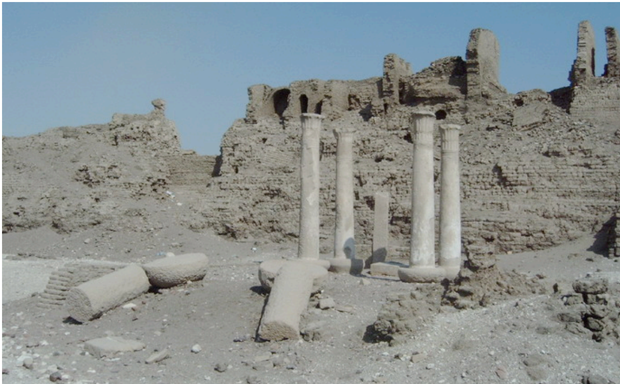
Haus des Butehamun in Medinet Habu

Wir wissen, dass Butehamun ein vermöglicher Mann war. Die instabile Situation veranlasste die Gemeinschaft von Deir el Medina, in den nahegelegenen Tempel von Medinet Habu umzusiedeln. Dort ließ sich Butehamun ein prachtvolles Haus bauen, dessen Überreste noch heute zu besichtigen sind. Andere Quellen belegen, dass er Rinder besaß, was im alten Ägypten schon als Wohlstand bezeichnet werden konnte.