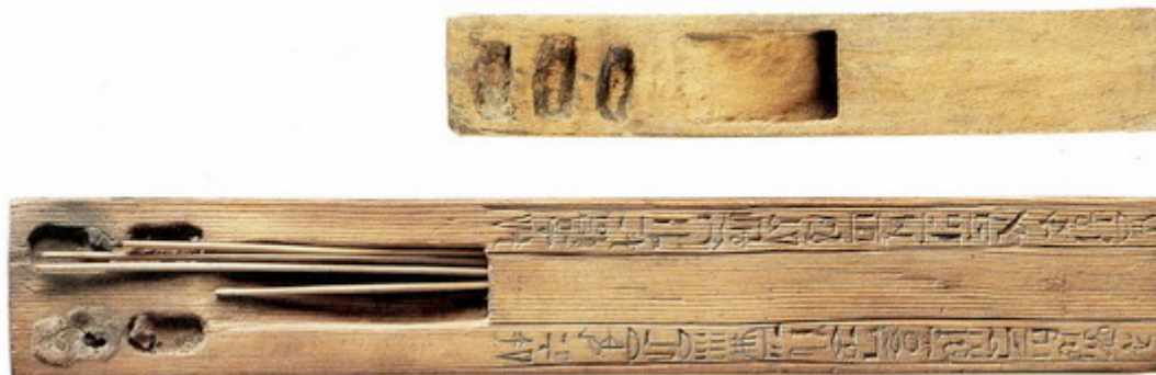
Paletten eines Schreibers: Louvre 14081 (Oben) Louvre 3023 (Unten)

Seine Rolle in Deir el Medina und anderen Verwaltungen war eine sehr wichtige. Es oblag ihm, die Aktivitäten und Löhne zu dokumentieren sowie mit anderen Behörden zu korrespondieren. Die Zerteilung der Gemeinschaft von Deir el Medina erforderte auch zwei Schreiber, für jede Seite (Team) einen. Des Weiteren waren zwei Schreiber bei den beiden Logistikmannschaften (smdt) beschäftigt. Die Position des Schreibers folgte direkt der des Vormanns, sie erhielten in etwa den halben Lohn verglichen mit einem Vormann. Hierarchisch gesehen unterstanden die Schreiber jedoch nicht einem Vormann sondern dem Wesir. Als Angestellte des Pharaos wurden manche Schreiber mit dem Titel "Königlicher Schreiber" ausgezeichnet. Die wichtige Aufgabe eines Schreibers des Grabes war die, sicherzustellen, dass die gestellte Aufgabe zuverlässig erledigt wurde. Er führte Anwesenheitslisten, hielt die Fehlgründe fest und dokumentierte die tägliche Arbeitsleistung. Eine weitere Aufgabe war der Empfang und die Verteilung von Material an die Arbeiter. Die Schreiber unterhielten eine detaillierte Buchführung, in der sie die Rationen für die Beschäftigten, im besonderen Getreide, festhielten. Das Getreide empfing der Schreiber von den königlichen Speichern, in manchen Fällen wurde es mit Hilfe von zwei Torhütern direkt von den Farmern abgeholt.