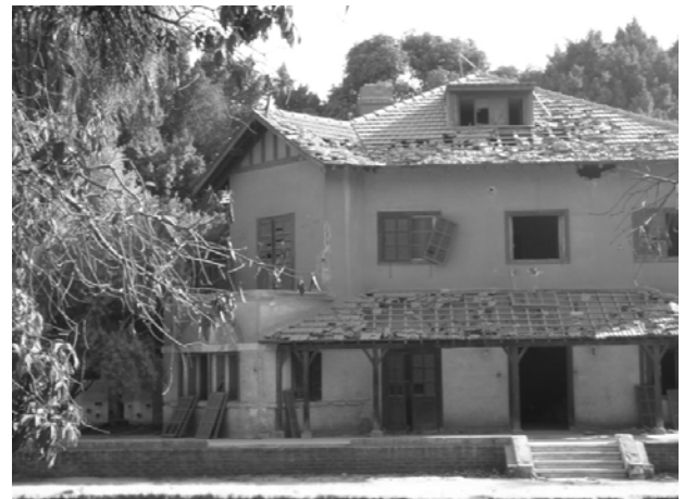
Bild oben/unten rechts: Der Zustand der Villa heute nach 100 Jahren